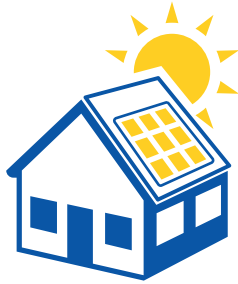
Einfamilienhaus mit PV-Anlage